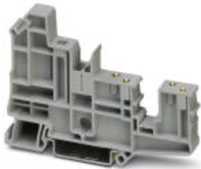
Screw flange, Connection method: Screw connection, Width: 8.2 mm, Mounting type: NS 35/7,5, NS 35/15

Please be informed that the data shown in this PDF Document is generated from our Online Catalog. Please find the complete data in the user's documentation. Our General Terms of Use for Downloads are valid ( http://download.phoenixcontact.com )