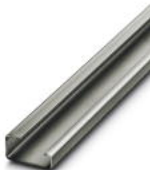
G-profile DIN rail, material: Steel, unperforated, height 15 mm, width 32 mm, length 2 m

Please be informed that the data shown in this PDF Document is generated from our Online Catalog. Please find the complete data in the user's documentation. Our General Terms of Use for Downloads are valid ( http://download.phoenixcontact.com )