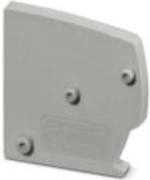
Spacer plate, Color: gray

Please be informed that the data shown in this PDF Document is generated from our Online Catalog. Please find the complete data in the user's documentation. Our General Terms of Use for Downloads are valid ( http://download.phoenixcontact.com )