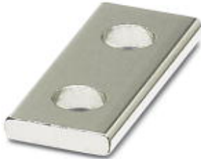
Connection rail, Number of positions: 2, Color: silver

Please be informed that the data shown in this PDF Document is generated from our Online Catalog. Please find the complete data in the user's documentation. Our General Terms of Use for Downloads are valid ( http://phoenixcontact.com/download )