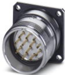
Device connector for rear wall, straight, Screw locking, M23, Flat gasket, 4x Ø2,7, Panel thickness min.: 2.7 mm, Panel thickness max.: 3.5 mm

Please be informed that the data shown in this PDF Document is generated from our Online Catalog. Please find the complete data in the user's documentation. Our General Terms of Use for Downloads are valid ( http://phoenixcontact.com/download )