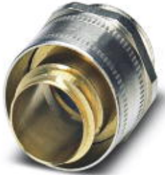
Cable gland made from brass with metric thread, rotatable, IP40 protection

Please be informed that the data shown in this PDF Document is generated from our Online Catalog. Please find the complete data in the user's documentation. Our General Terms of Use for Downloads are valid ( http://phoenixcontact.com/download )