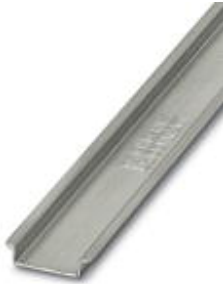
DIN rail, material: steel, unperforated, height: 7.5 mm, width: 35 mm, length: 1 m

Please be informed that the data shown in this PDF Document is generated from our Online Catalog. Please find the complete data in the user's documentation. Our General Terms of Use for Downloads are valid ( http://phoenixcontact.com/download )