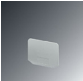
End cover, Width: 2.3 mm, Color: gray

Please be informed that the data shown in this PDF Document is generated from our Online Catalog. Please find the complete data in the user's documentation. Our General Terms of Use for Downloads are valid ( http://phoenixcontact.com/download )