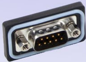
Panel Mount (DCPDB09MSC1)