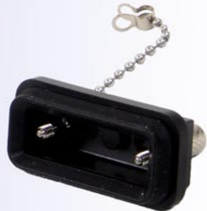
Connector Cap (DBSCAP)