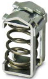
Shield connection terminal block, for applying the shield to busbars

Please be informed that the data shown in this PDF Document is generated from our Online Catalog. Please find the complete data in the user's documentation. Our General Terms of Use for Downloads are valid ( http://download.phoenixcontact.com )