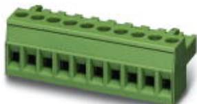
The figure shows a 10-position version of the product

PCB connector, nominal current: 12 A, number of positions: 4, pitch: 5 mm, connection method: Screw connection with tension sleeve, color: red, contact surface: Tin