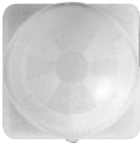
• FRONT SIDE