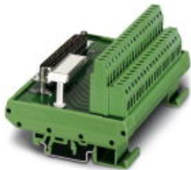
VARIOFACE module, with screw connection and D-Subminiature pin strip, for mounting on NS 35/7.5 or NS 32, 25-pos.

Please be informed that the data shown in this PDF Document is generated from our Online Catalog. Please find the complete data in the user's documentation. Our General Terms of Use for Downloads are valid ( http://phoenixcontact.com/download )