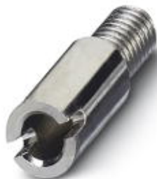
Female test connector, Color: silver

Please be informed that the data shown in this PDF Document is generated from our Online Catalog. Please find the complete data in the user's documentation. Our General Terms of Use for Downloads are valid ( http://download.phoenixcontact.com )