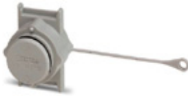
Protective cover, IP67, tall design

Please be informed that the data shown in this PDF Document is generated from our Online Catalog. Please find the complete data in the user's documentation. Our General Terms of Use for Downloads are valid ( http://download.phoenixcontact.com )