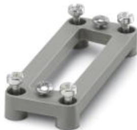
D-SUB adapter plate, for one D-SUB connector, no. of positions 25, housing series HC-D 15...

Please be informed that the data shown in this PDF Document is generated from our Online Catalog. Please find the complete data in the user's documentation. Our General Terms of Use for Downloads are valid ( http://phoenixcontact.com/download )