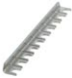
Fixed bridge, Number of positions: 10, Color: silver

Please be informed that the data shown in this PDF Document is generated from our Online Catalog. Please find the complete data in the user's documentation. Our General Terms of Use for Downloads are valid ( http://phoenixcontact.com/download )