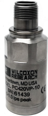
Table 1: PC420Vx-yy model selection guide

Wilcoxon's PC420V series sensors provide a 4-20 mA output proportional to velocity vibration, allowing for continuous trending of overall machine vibration. This trend data alerts users to changing machine conditions and helps guide maintenance in prioritizing the need for service. The choice of RMS or peak output allows you to choose the sensor that best fits your requirements.