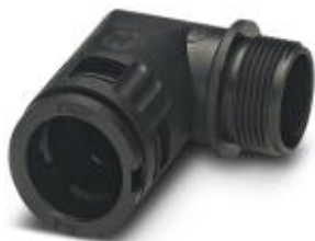
Cable gland, metric thread, IP66 protection, angled

Please be informed that the data shown in this PDF Document is generated from our Online Catalog. Please find the complete data in the user's documentation. Our General Terms of Use for Downloads are valid ( http://phoenixcontact.com/download )