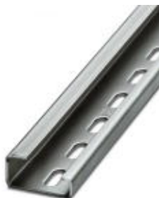
G-profile DIN rail, material: Steel, perforated, height 15 mm, width 32 mm, length 2 m

Please be informed that the data shown in this PDF Document is generated from our Online Catalog. Please find the complete data in the user's documentation. Our General Terms of Use for Downloads are valid ( http://download.phoenixcontact.com )