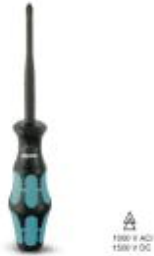
Screwdriver, crosshead PH (lasered), insulated, size: PH 2 x 100, 2-component handle, with non-slip grip

Please be informed that the data shown in this PDF Document is generated from our Online Catalog. Please find the complete data in the user's documentation. Our General Terms of Use for Downloads are valid ( http://download.phoenixcontact.com )