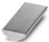
Insertion profile, Color: silver