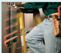
Drop-proof to 6 feet (2.9m)