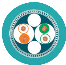
PUR ETHERNET 2x2 FLEX [93E]