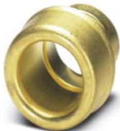
End sleeves as cable protection, made of brass, for WP-STEEL PVC C

Please be informed that the data shown in this PDF Document is generated from our Online Catalog. Please find the complete data in the user's documentation. Our General Terms of Use for Downloads are valid ( http://phoenixcontact.com/download )