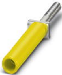
Female test connector, Color: yellow

Please be informed that the data shown in this PDF Document is generated from our Online Catalog. Please find the complete data in the user's documentation. Our General Terms of Use for Downloads are valid ( http://phoenixcontact.com/download )