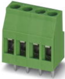
PCB terminal block, nom. voltage: 400 V, pitch: 5.08 mm, number of positions: 6, connection method: Screw connection with tension sleeve, mounting: Wave soldering, color: green

Please be informed that the data shown in this PDF Document is generated from our Online Catalog. Please find the complete data in the user's documentation. Our General Terms of Use for Downloads are valid ( http://phoenixcontact.com/download )