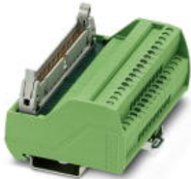
VARIOFACE termination board, to transmit max. 16 channels, only in connection with FLKM 50-PA-SLC 500 OUT/2 A

Please be informed that the data shown in this PDF Document is generated from our Online Catalog. Please find the complete data in the user's documentation. Our General Terms of Use for Downloads are valid ( http://phoenixcontact.com/download )