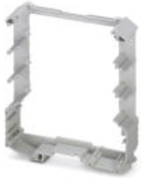
Complete housing, length: 99 mm, Central part, color: light gray, width: 45 mm

Please be informed that the data shown in this PDF Document is generated from our Online Catalog. Please find the complete data in the user's documentation. Our General Terms of Use for Downloads are valid ( http://phoenixcontact.com/download )