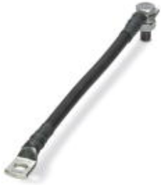
Connecting cable for FLT-ISG-100-EX, length 200 mm.

Please be informed that the data shown in this PDF Document is generated from our Online Catalog. Please find the complete data in the user's documentation. Our General Terms of Use for Downloads are valid ( http://phoenixcontact.com/download )