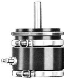
SERVO MOUNT/BALL BEARING MODEL 1721