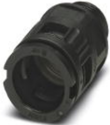
Cable gland, Pg thread, IP68/69k protection, straight

Please be informed that the data shown in this PDF Document is generated from our Online Catalog. Please find the complete data in the user's documentation. Our General Terms of Use for Downloads are valid ( http://phoenixcontact.com/download )