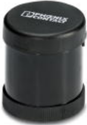
Buzzer element, continuous/pulse tone, 24 V AC/DC, max. 85 dB(A), black

Please be informed that the data shown in this PDF Document is generated from our Online Catalog. Please find the complete data in the user's documentation. Our General Terms of Use for Downloads are valid ( http://phoenixcontact.com/download )