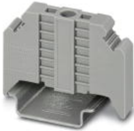
End clamp, width: 9.5 mm, color: gray

Please be informed that the data shown in this PDF Document is generated from our Online Catalog. Please find the complete data in the user's documentation. Our General Terms of Use for Downloads are valid ( http://download.phoenixcontact.com )