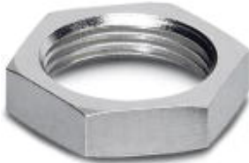
Flat nut with M8 thread

Please be informed that the data shown in this PDF Document is generated from our Online Catalog. Please find the complete data in the user's documentation. Our General Terms of Use for Downloads are valid ( http://download.phoenixcontact.com )