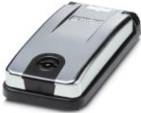
Mounting frame for one front plate/socket, frame: black, cover: metallic, closed with 3 mm two-way key bit.

Please be informed that the data shown in this PDF Document is generated from our Online Catalog. Please find the complete data in the user's documentation. Our General Terms of Use for Downloads are valid ( http://phoenixcontact.com/download )