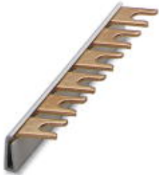
Wiring bridge for modules with connecting pitch 17.5 mm, 1-phase, 6-pos.

Please be informed that the data shown in this PDF Document is generated from our Online Catalog. Please find the complete data in the user's documentation. Our General Terms of Use for Downloads are valid ( http://download.phoenixcontact.com )