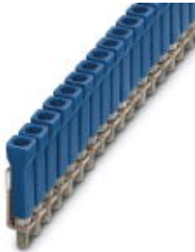
Jumper, Number of positions: 100, Color: blue

Please be informed that the data shown in this PDF Document is generated from our Online Catalog. Please find the complete data in the user's documentation. Our General Terms of Use for Downloads are valid ( http://download.phoenixcontact.com )