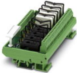
VARIOFACE module, for 8 plug-in miniature relays or miniature optocouplers, with LED, 230 V AC input voltage

Please be informed that the data shown in this PDF Document is generated from our Online Catalog. Please find the complete data in the user's documentation. Our General Terms of Use for Downloads are valid ( http://phoenixcontact.com/download )