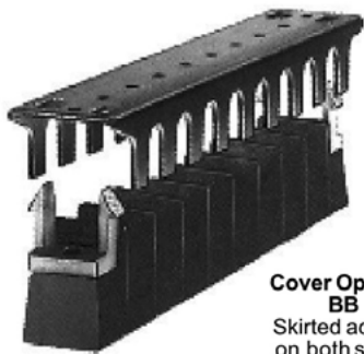
Cover Options BB Skirted access on both sides.