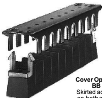
Cover Options BB Skirted access on both sides.