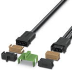
SUNCLIX micon sample set, consisting of AC-Y, mains connector for plug and socket side, dust protection caps, IP protective caps, and unlocking tool

Please be informed that the data shown in this PDF Document is generated from our Online Catalog. Please find the complete data in the user's documentation. Our General Terms of Use for Downloads are valid ( http://phoenixcontact.com/download )