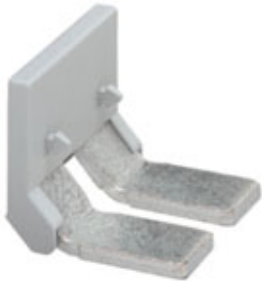
Insertion bridge, Number of positions: 2, Color: gray

Please be informed that the data shown in this PDF Document is generated from our Online Catalog. Please find the complete data in the user's documentation. Our General Terms of Use for Downloads are valid ( http://phoenixcontact.com/download )