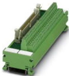
VARIOFACE module, with screw connection and flat-ribbon cable connector, for assembly on NS 35/7.5, 26 positions

Please be informed that the data shown in this PDF Document is generated from our Online Catalog. Please find the complete data in the user's documentation. Our General Terms of Use for Downloads are valid ( http://phoenixcontact.com/download )