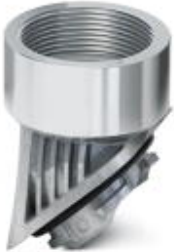
Adapter, aluminum, for EVO housing, M25 thread

Please be informed that the data shown in this PDF Document is generated from our Online Catalog. Please find the complete data in the user's documentation. Our General Terms of Use for Downloads are valid ( http://phoenixcontact.com/download )