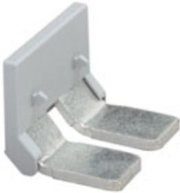
Insertion bridge, Number of positions: 2, Color: gray

Please be informed that the data shown in this PDF Document is generated from our Online Catalog. Please find the complete data in the user's documentation. Our General Terms of Use for Downloads are valid ( http://phoenixcontact.com/download )