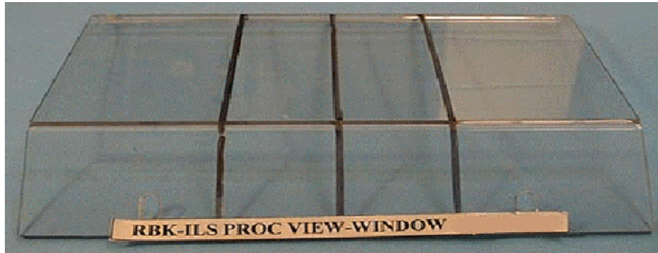
REPLACEMENT LOCKABLE COVER WINDOWS