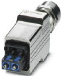
Push-pull connector (version 14), die-cast zinc, with SC-RJ insert for POF, for cable diameter of 5.5 mm ... 10 mm, cable outlet at the bottom

Please be informed that the data shown in this PDF Document is generated from our Online Catalog. Please find the complete data in the user's documentation. Our General Terms of Use for Downloads are valid ( http://phoenixcontact.com/download )