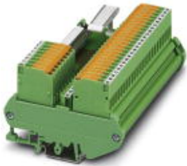
VARIOFACE module, with knife disconnect terminal blocks for: -S800 I/O input module, module width: 126.5 mm

Please be informed that the data shown in this PDF Document is generated from our Online Catalog. Please find the complete data in the user's documentation. Our General Terms of Use for Downloads are valid ( http://phoenixcontact.com/download )