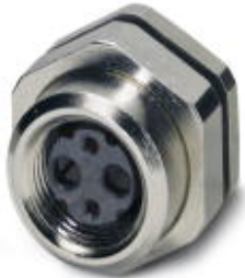
Fiber optics coupling M12, duplex, suitable for all fibers, with wall bracket, IP65 degree of protection

Please be informed that the data shown in this PDF Document is generated from our Online Catalog. Please find the complete data in the user's documentation. Our General Terms of Use for Downloads are valid ( http://phoenixcontact.com/download )